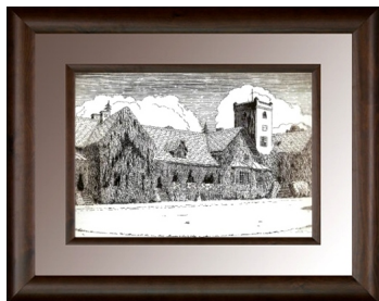
Zamek Moja Wola - grafika

Moja Wola - obecnie osada w powiecie ostrowskim, w województwie wielkopolskim, w gminie Sośnie